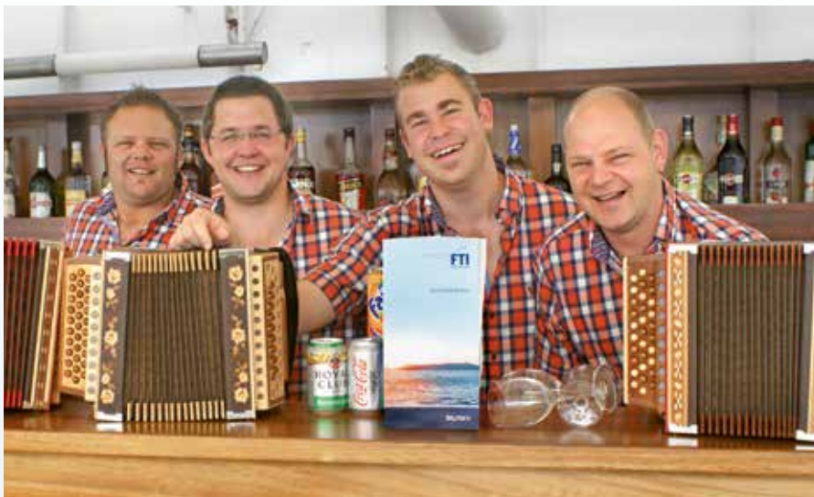
Erinnerungen an die Folklore-Kreuzfahrt 2013 auf dem Mittelmeer.