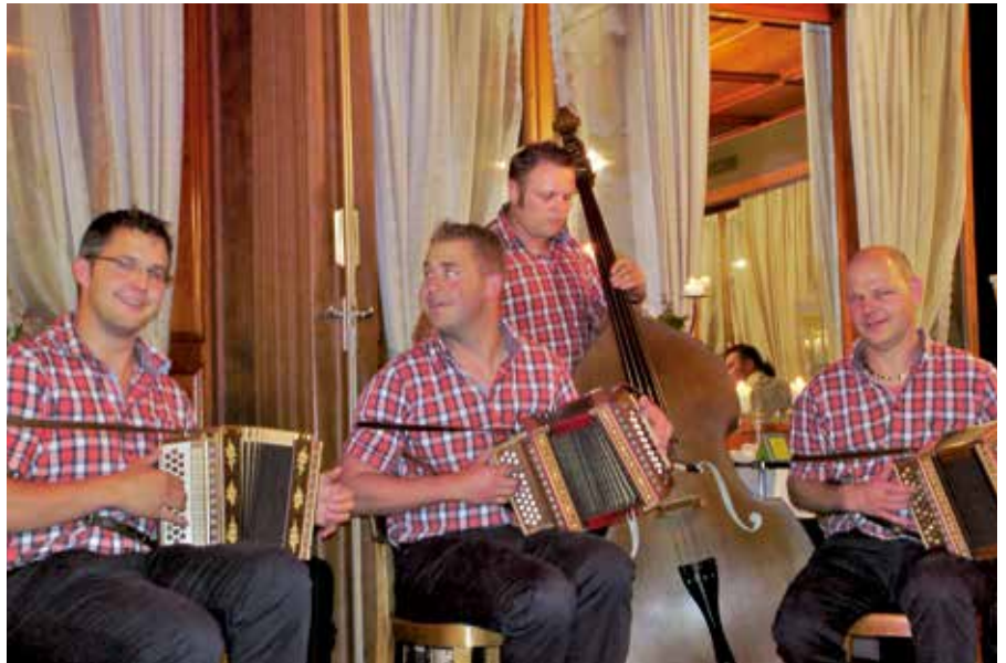
Die Bärner Ländlers unlängst bei einem Auftritt in Schangnau.